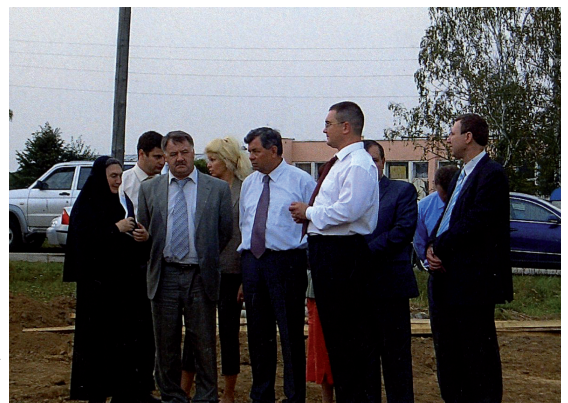
Приезд губернатора Артамонова А.Д., министра сел.ского хозяйства Громова Л.С., главы администрации Смоленского Р.В. на место строительства храма