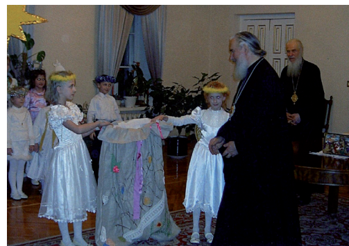
Любящий всех, Владыка щедро одаривает колядников, поздравляя взаимно с Рождеством Христовым