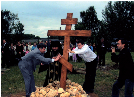
Установление креста на месте строительства храма

В 2007 году жители пос. Лесной обратились с письмом в Калужскую Епархию с просьбой о строительстве православного храма в честь Преподобного священномученика Кукши, который, как и Апостолы Христа, проповедовал в этих местах, в 12 веке, веру Христову.