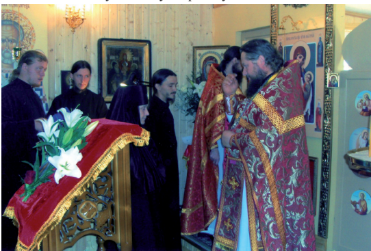
Первая Литургия в день празднования памяти священномученика Кукши 9 сентября 2010г.