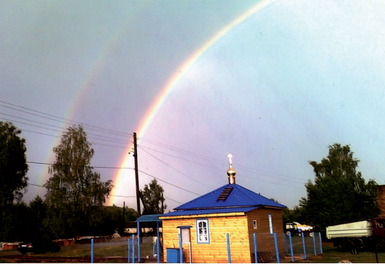
За день до освящения храма-часовни в честь Божией Матери «Нечаянная радость» Господь показал милость свою над этим местом. Невозможно описать никакими словами эту явленную красоту Божию.