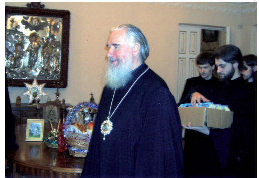
Радостное напутственное слово Владыки: «Вы православные и живете в центре России, за нее болейте, ее любите, духом Христовой церкви живите, благодарите Бога за все, не отступайте от православной веры».

Как в детстве тихо и наивно, Люблю в Рождественской ночи, Звезды осьмиконечной, дивной, Ко мне летящие лучи. Когда вся церковь замирает, Раскрыты Царские Врата, Стоит, земли не задевая, Крылатый ангел. И уста Не движутся, но льются звуки. Здесь небо снизошло к земле, Благословляющие руки Я ощущаю на челе. И запах ладана и ели, Свечей живые огоньки, И невесомость во всем теле От прикоснувшейся руки. Я с этим чудом в мир вступаю – Надолго хватит! И на всех! Благословенна Ночь Святая И звезды сыплются на снег.