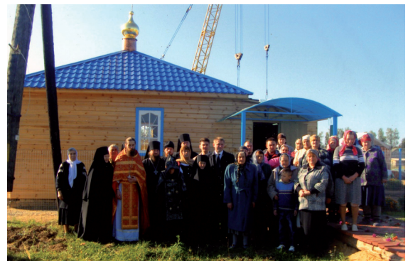
Прихожане 1й Литургии.

Общая атмосфера духовной радости дополнялась «благорастворением воздуш». Мягкое теплое солнышко, безветренная погода, осенняя зелень создавали в сердцах молящихся умиротворение и ощущение присутствия Божиего, приводя на память слова из Священного Писания о явлении Господа в веянии тихого ветра.