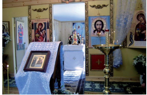
Храм-часовня в честь Божией Матери «Нечаянная радость» готов к освящению. 26.08.2010. в праздник отдание Преображения Господня освятили храм.