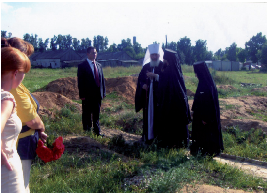
Приезд Владыки в село в день апостолов Петра и Павла