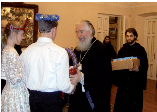
Поздравили любимого Владыку сельскими подарками, приготовленными своими руками